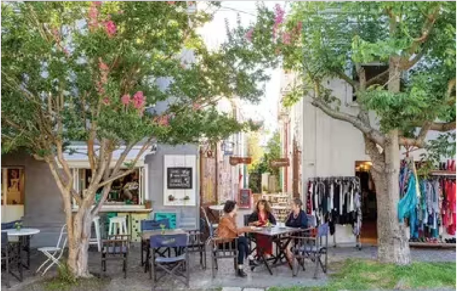
En Tigre. El boulevard que concentra arte, cultura y gastronomía