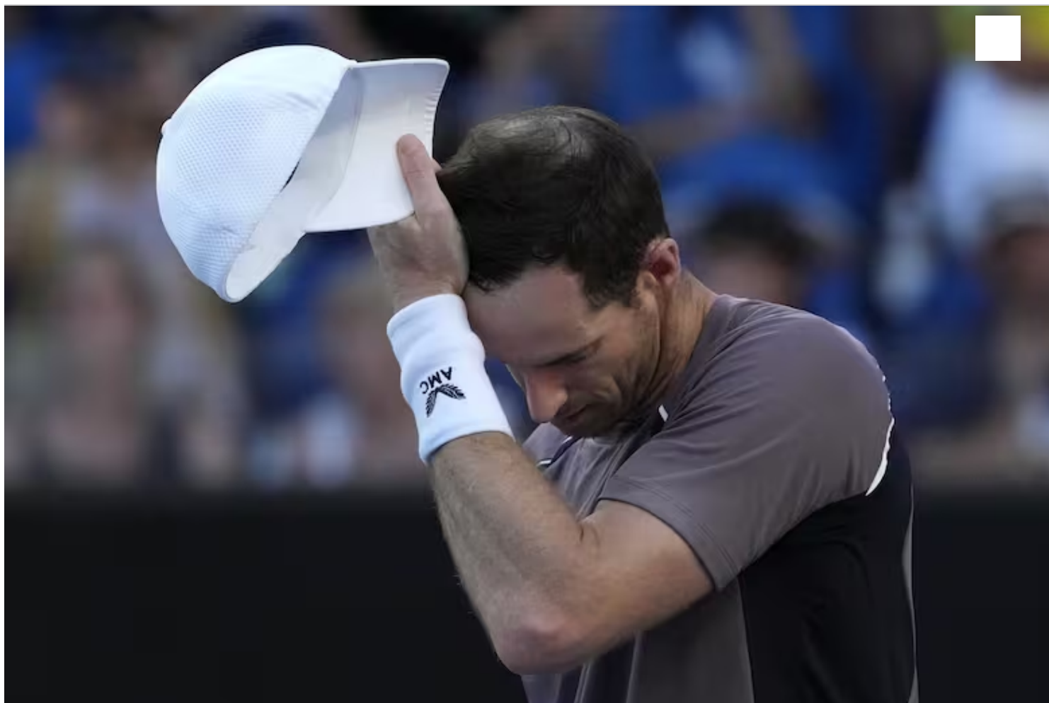
La frustración de Andy Murray: "No ganaré mucho más si sigo jugando de esta manera"