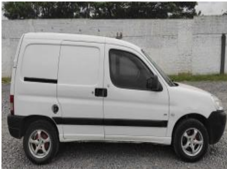
Peugeot Partner Confort 1.6 HDI Furgoneta / Utilitario, Año: 2014 , Combustible: Diesel, Precio: Consultar