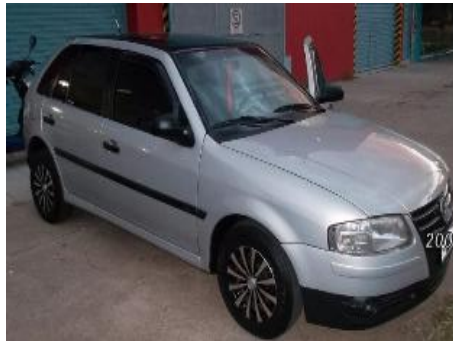
Volkswagen Gol 1.6 Full Hatchback, Año: 2007 , Combustible: Sin Especificar, Precio: Consultar