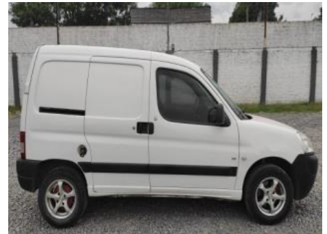
Peugeot Partner Confort 1.6 HDI Furgoneta / Utilitario, Año: 2015 , Combustible: Diesel, Precio: Consultar