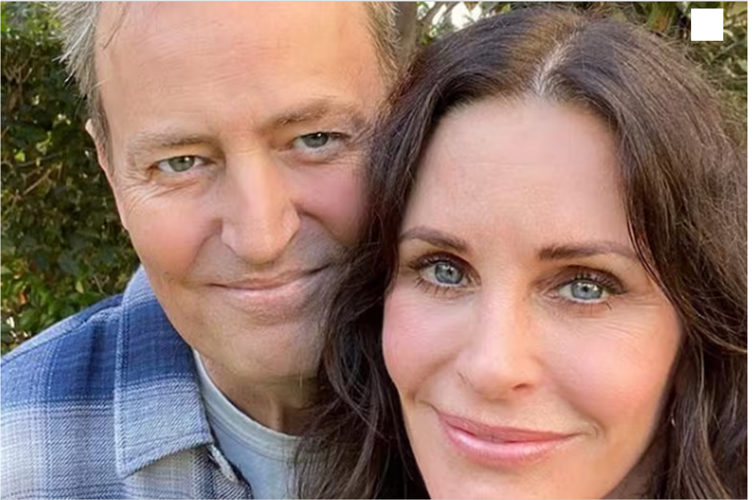
Matthew Perry y Courteney Cox

Cuando recuperaba la sobriedad y la lucidez artística volvía a aparecer el Perry más talentoso y dotado para la comedia. Así se fue sucediendo la historia televisiva post-Chandler del actor. Primero con Studio 60 en Sunset Strip y luego con Mr. Sunshine y Go On , series que empezaron de manera promisorias, pero luego no encontraron continuidad. Algo más lejos llegó con la remake televisiva de Extraña pareja , donde encarnó al personaje que en el cine había impuesto Walter Matthau.