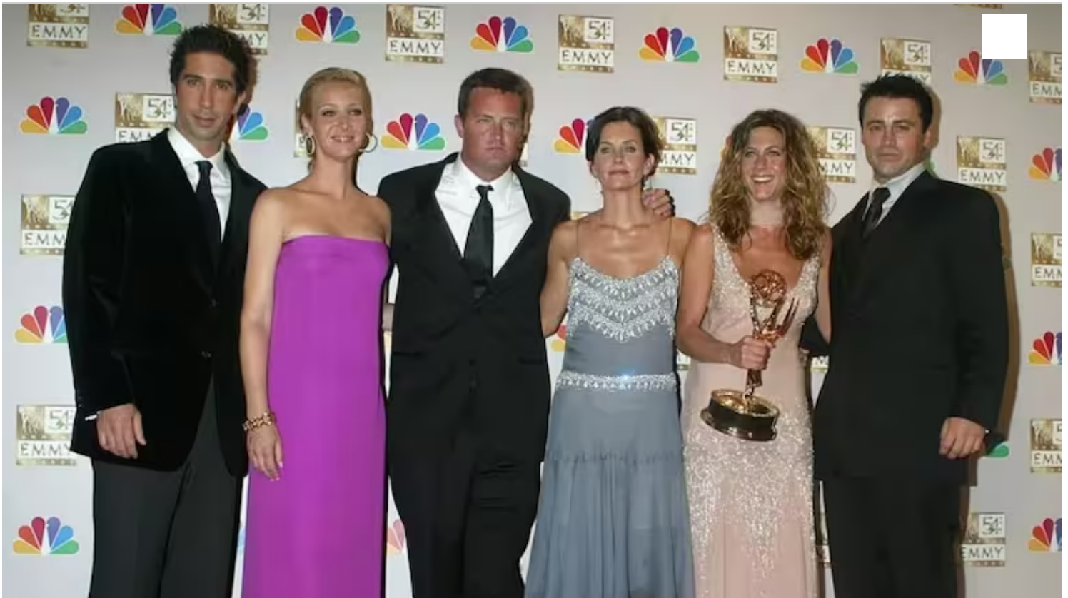
Schwimmer, Kudrow, Perry, Cox, Aniston y LeBlanc en el momento de gloria de Friends

Esta mención no podía faltar de ningún modo en el momento final de una estrella que tuvo en sus manos un triunfo y una derrota sin límites. Cuando había alcanzado con creces su sueño de ser famoso y multimillonario empezó (o más bien profundizó) un camino de autodestrucción que por algún tipo de milagro no terminó antes de la peor manera.