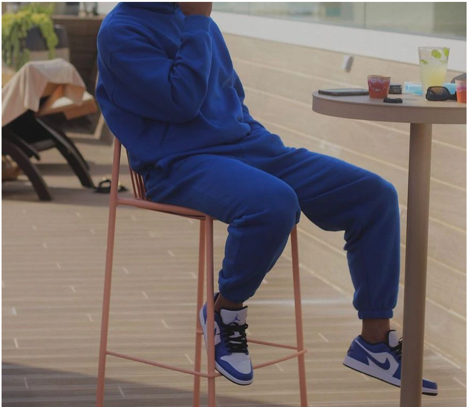
El príncipe se muestra como si fuera un modelo publicitario: ropa de primer nivel y vida de lujos Instagram @fjefrib