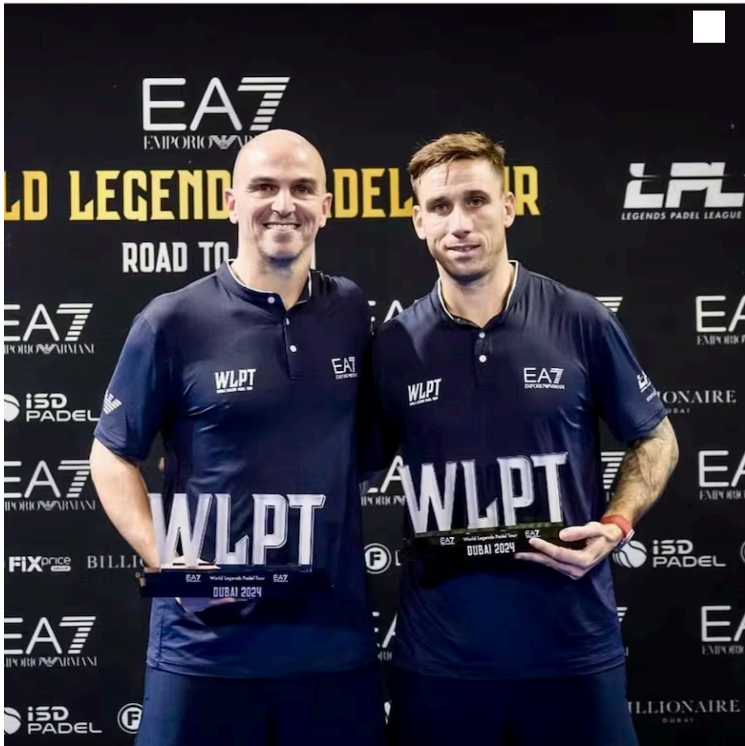
Fanáticos: con "Cuchu" Cambiasso, hace algunas semanas, subcampeones del World Legends Pádel Tour, en Dubai

¿Pádel? Todo un especialista. Hace un par de semanas, en Dubai, con ‘Cuchu’ Cambiasso de compañero, salieron subcampeones de un torneo del