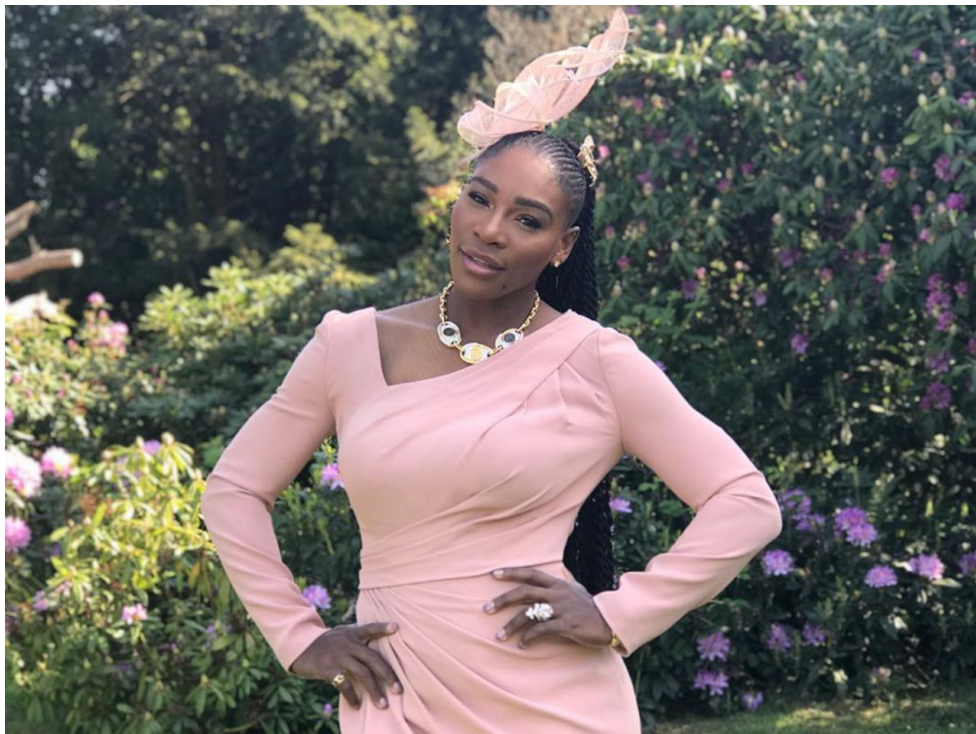
Serena Williams, una pujante empresaria.

Leé también: Serena Williams y Lewis Hamilton quieren comprar el Chelsea