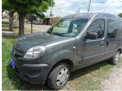
Renault Kangoo Confort 1.6 2 PCL Furgoneta / Utilitario, 96000Kms., Año: 2016 , Combustible: GNC, Precio: Consultar