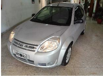
Ford KA Viral 1.0 Hatchback, 39000Kms., Año: 2009 , Combustible: Nafta, Precio: Consultar