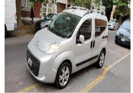
Fiat Qubo 1.4 8V Dynamic Full-Full Furgoneta / Utilitario, 99700Kms., Año: 2012 , Combustible: Nafta, Precio: $1.25e+006