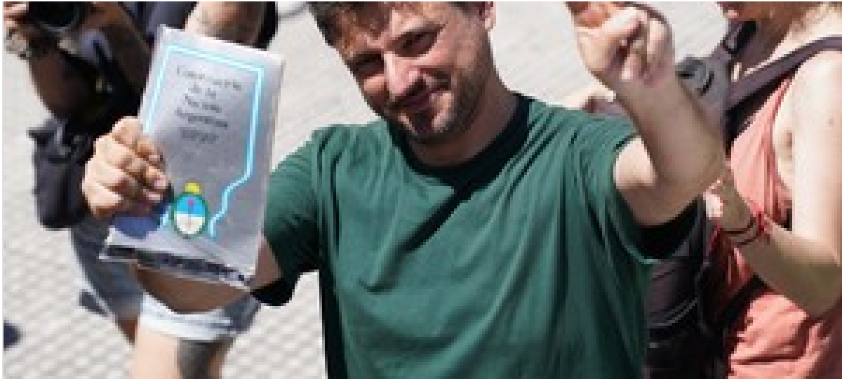
La descomunal caja que manejó Grabois con aval K y de Alberto Fernández: US$ 244 millones en cuatro años