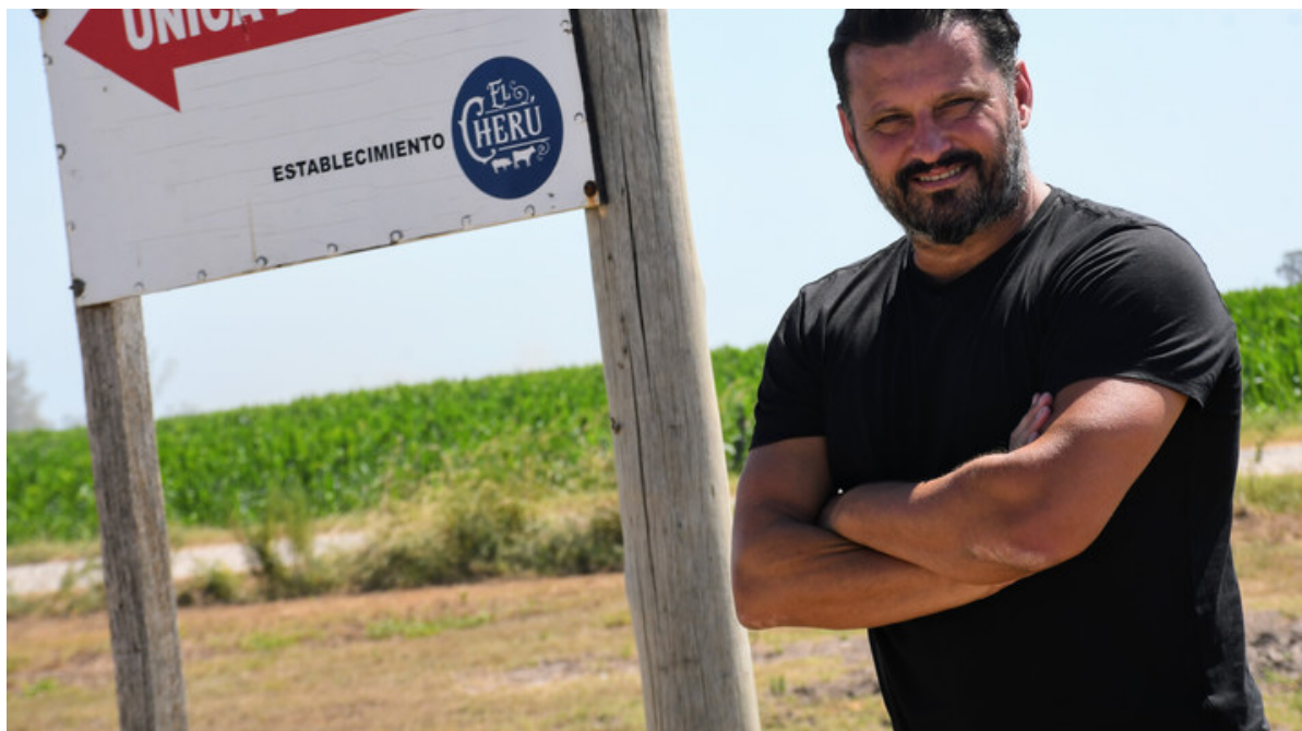
En la entrada del campo en Maciel.

El plan de trabajo habitual es vender 80 hectáreas por año , pero en el último ciclo no lo hicieron porque el precio era muy bajo, por lo que decidió acopiar la producción para venderla en un marco más positivo para la actividad. “Estamos esperando que empiece a moverse la actividad porque esto es cuestión de tiempo. Es un negocio distinto. Se puede esperar a venderlos. El eucalipto puede ser un poco más chico o grande, se lo puede sacar un poco antes o un poco después, pero están ahí, no es que sí o sí lo tenés que cortar”, explicó.