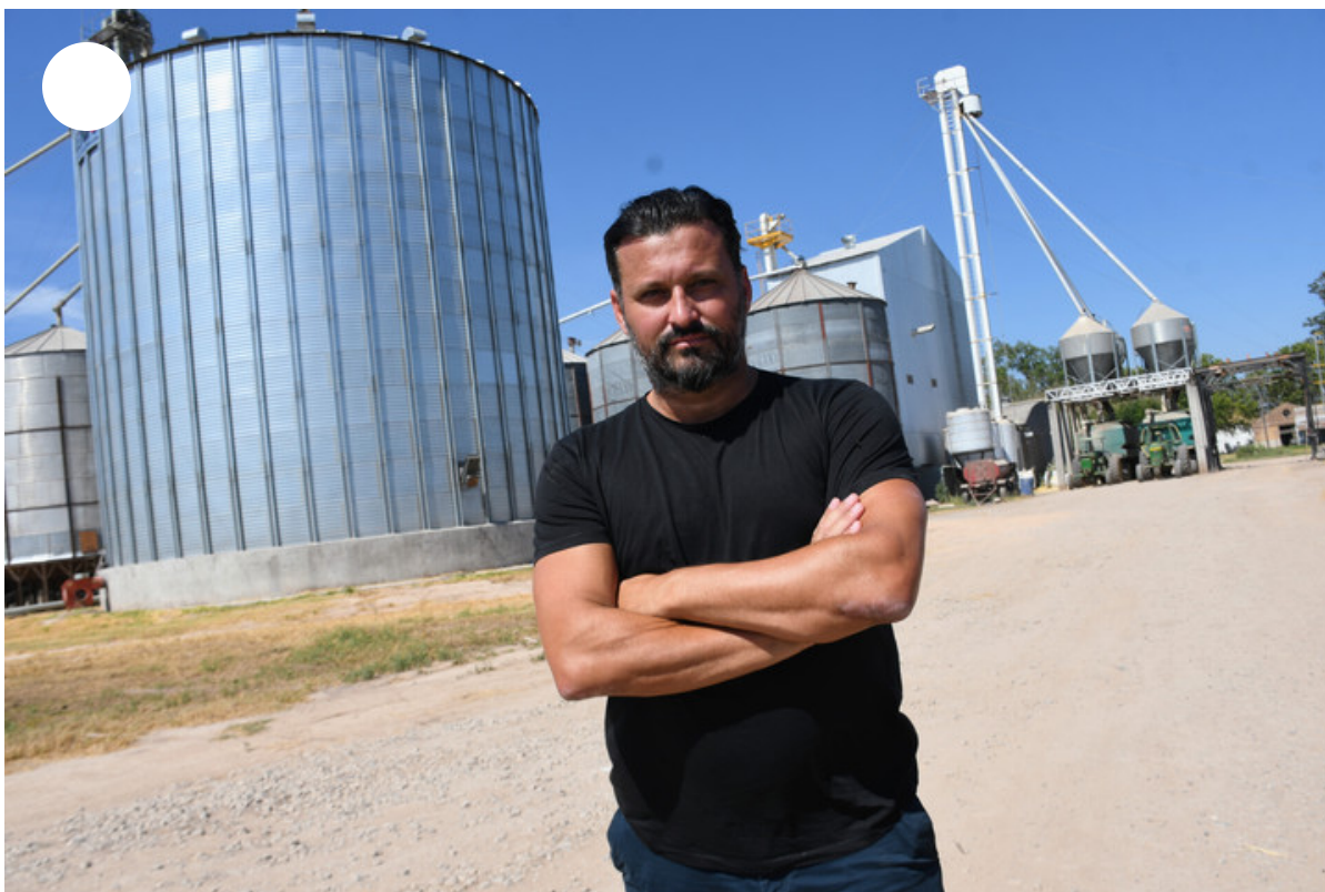
Tiene una planta de alimento balanceado para la granja porcina.

“Las primeras decisiones eran compartidas pero después fui creciendo y conociendo cada vez más los negocios. Ya hace 23 años que estoy en el sector”, comentó.