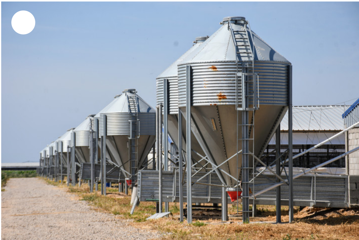
Granja porcina.

Actualmente, el exfutbolista tiene dos establecimientos agropecuarios : uno en Maciel (cerca de Rosario, Santa Fe) y otro en Esquina (Corrientes) donde fue desarrollando diferentes