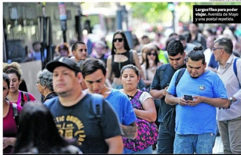
Larga fila para poder viajar. Avenida de Mayo y una postal repetida.

La ministra de Capital Humano, muy cercana al Presidente, acusa al titular de Economía de ser tirante sobre el Presupuesto nacional y no girarle la plata suficiente a su ministerio, que maneja la enorme caja de la ayuda social. Esta semana, Sandra Pettovello dejó su oficina llorando y faltó a una de las reuniones de Gabinete. Esto no es el primer conflicto con sus pares que tiene la funcionaria. A.15