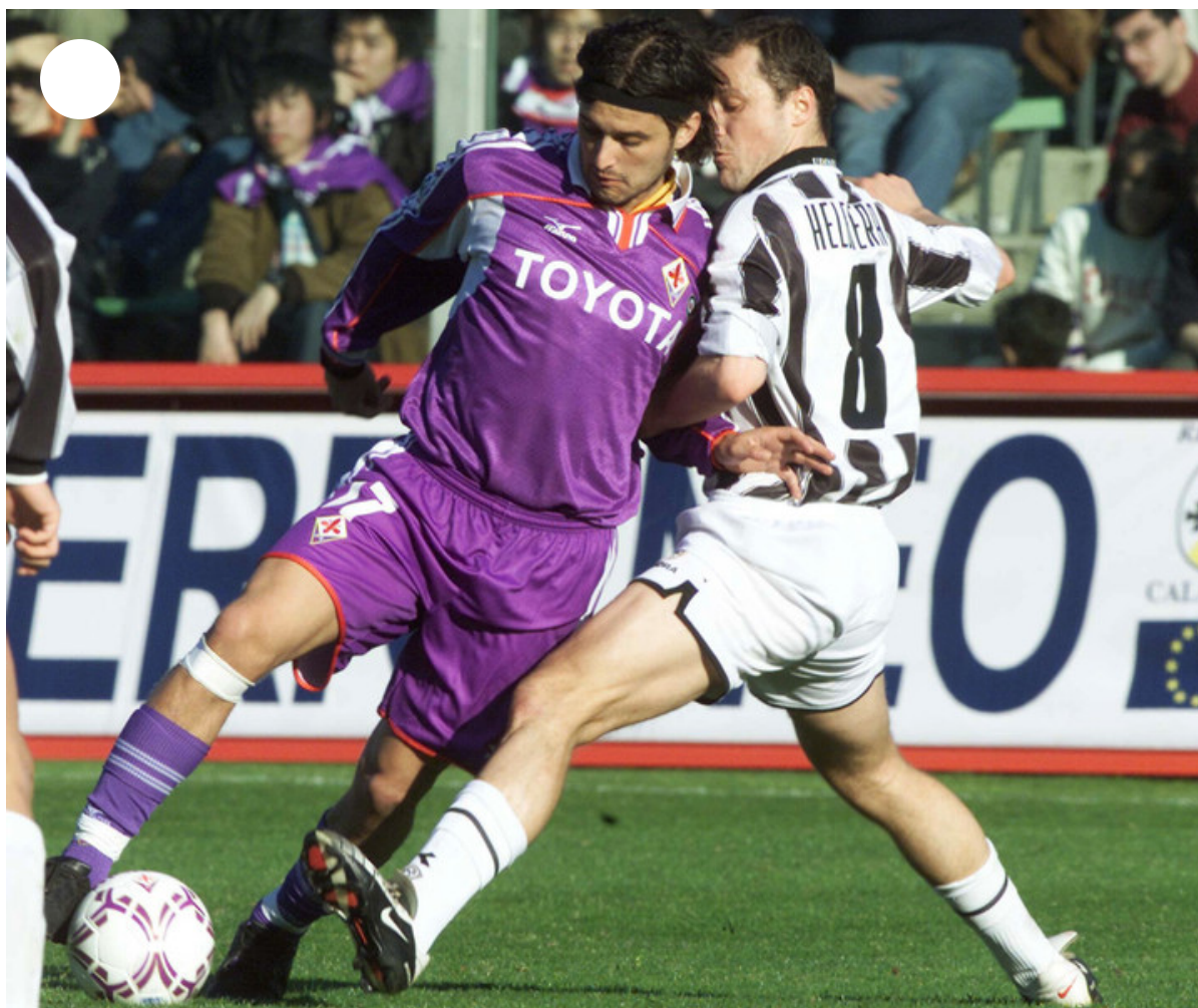
Con la camiseta de la Fiorentina.

Por el momento no exportan pero la idea es poder meterse en el negocio. “Es lo que se viene con esta apertura que tenemos al mundo. Tenemos que ser buenos compitiendo y para eso hay que tener buena infraestructura ”.