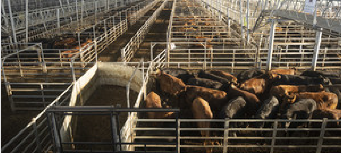
Retroceso en los valores de la hacienda liviana en el Mercado Agroganadero de Cañuelas