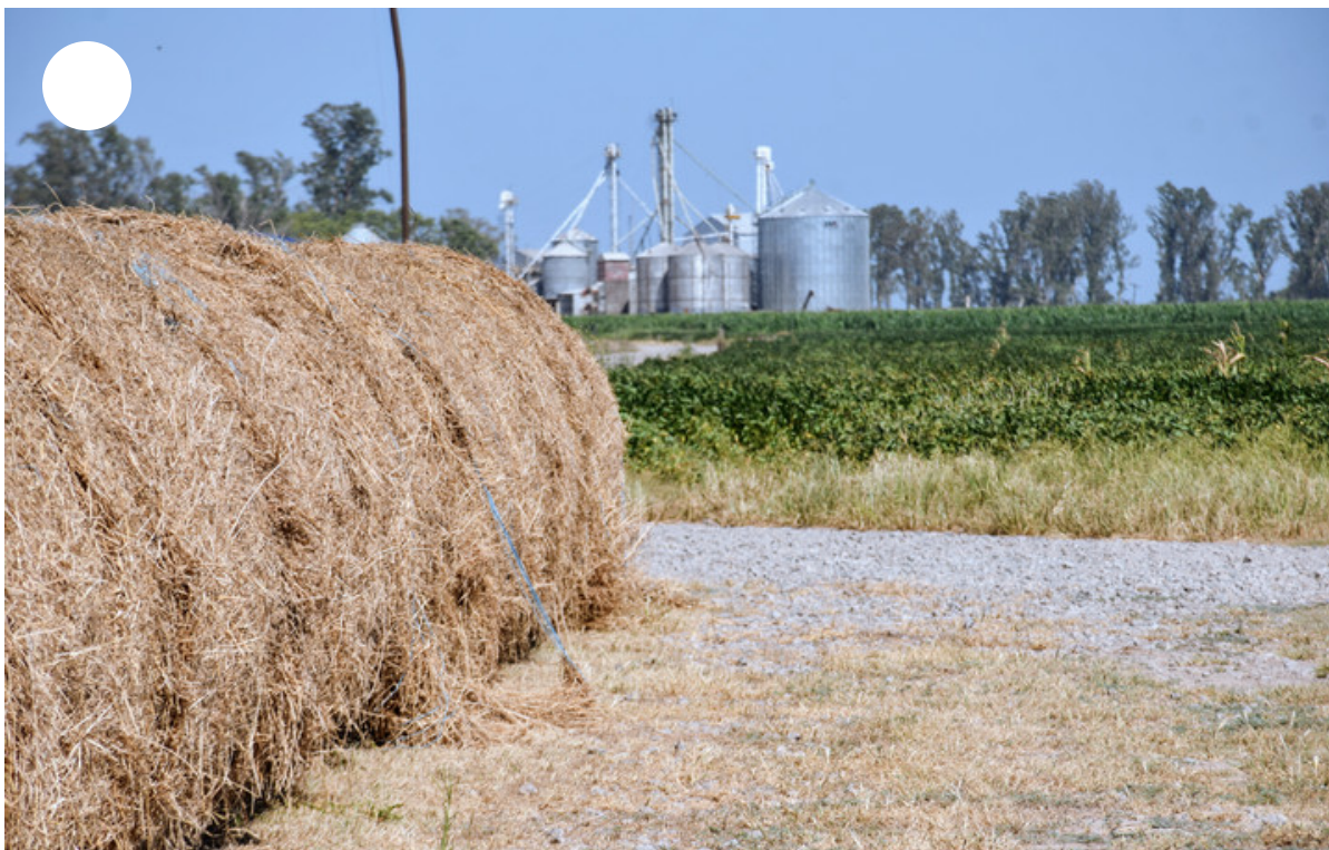
Rollos para la recria. Detrás, la soja.

“Ahora al fútbol lo veo como hincha. Llevo a mis hijos a la cancha. El fútbol sigue siendo mi pasión principal aunque todo esto que hago lo sustituyó. Toda la idiosincrasia que tenemos en la empresa la desarrollé desde el fútbol, como armar equipos de trabajo, siempre con los valores del fútbol. La verdad que me sirvió mucho”, afirmó, agregando que su deseo es volver al mundo del fútbol en algún momento como director técnico de su querido Rosario Central.