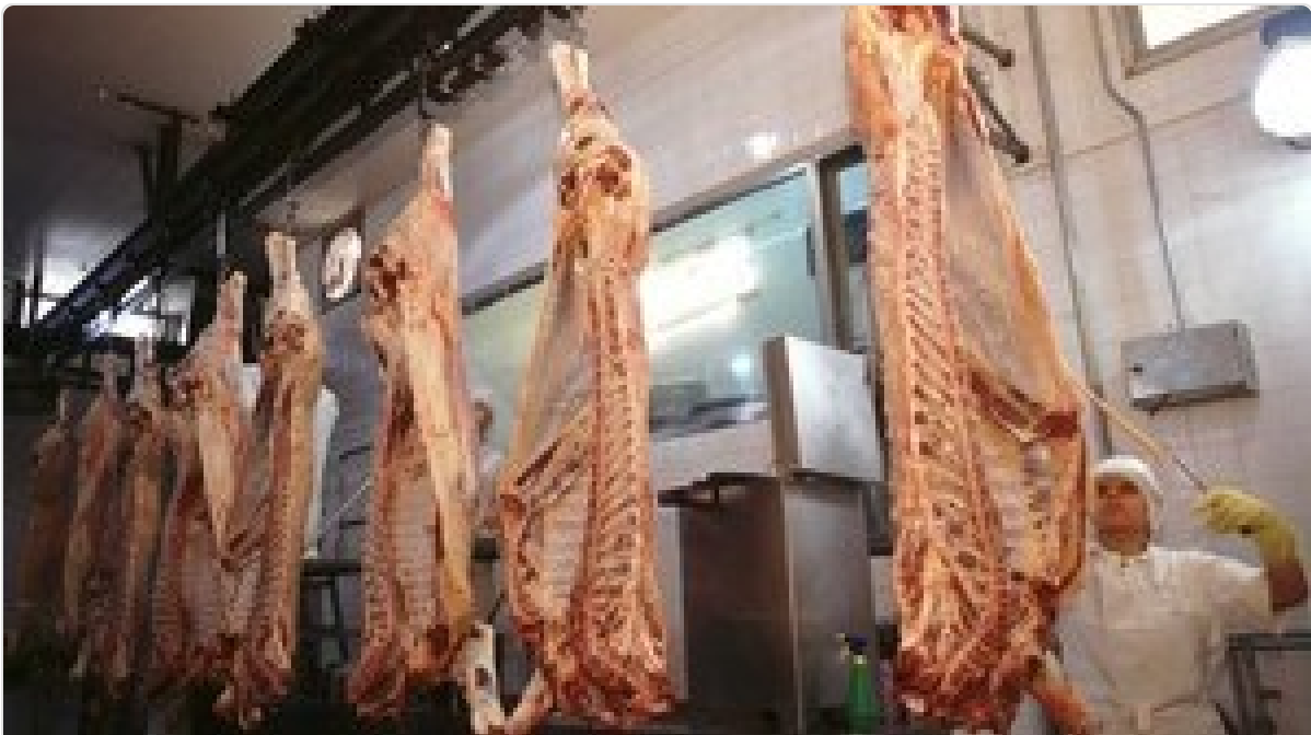
Radiografía de los frigoríficos que faenan y exportan en Argentina