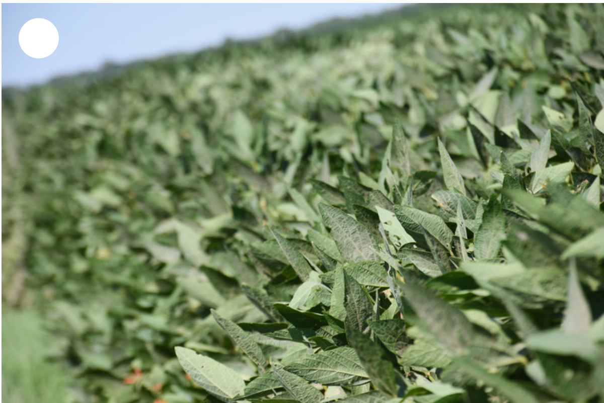
Soja en Maciel, cerca de Rosario.

Ahora van a desarrollar este año un frigorífico de ciclo 2 y 3 , que es para poder incorporar la producción de embutidos (jamón crudo, jamón cocido, paleta, salchichas, entre otros). Por ahora sólo hacen tres tipos de chorizos que tiene cada uno un nombre distintivo: El Cherú (por la empresa), Prasinoi (verde en griego, como le dicen a Panathinaikos) y Fiore (por el equipo italiano Fiorentina).