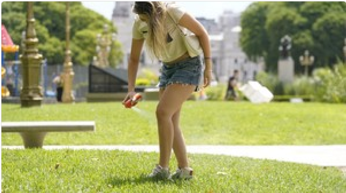
Crecen los casos de dengue: cuáles son los barrios con más casos en la Ciudad