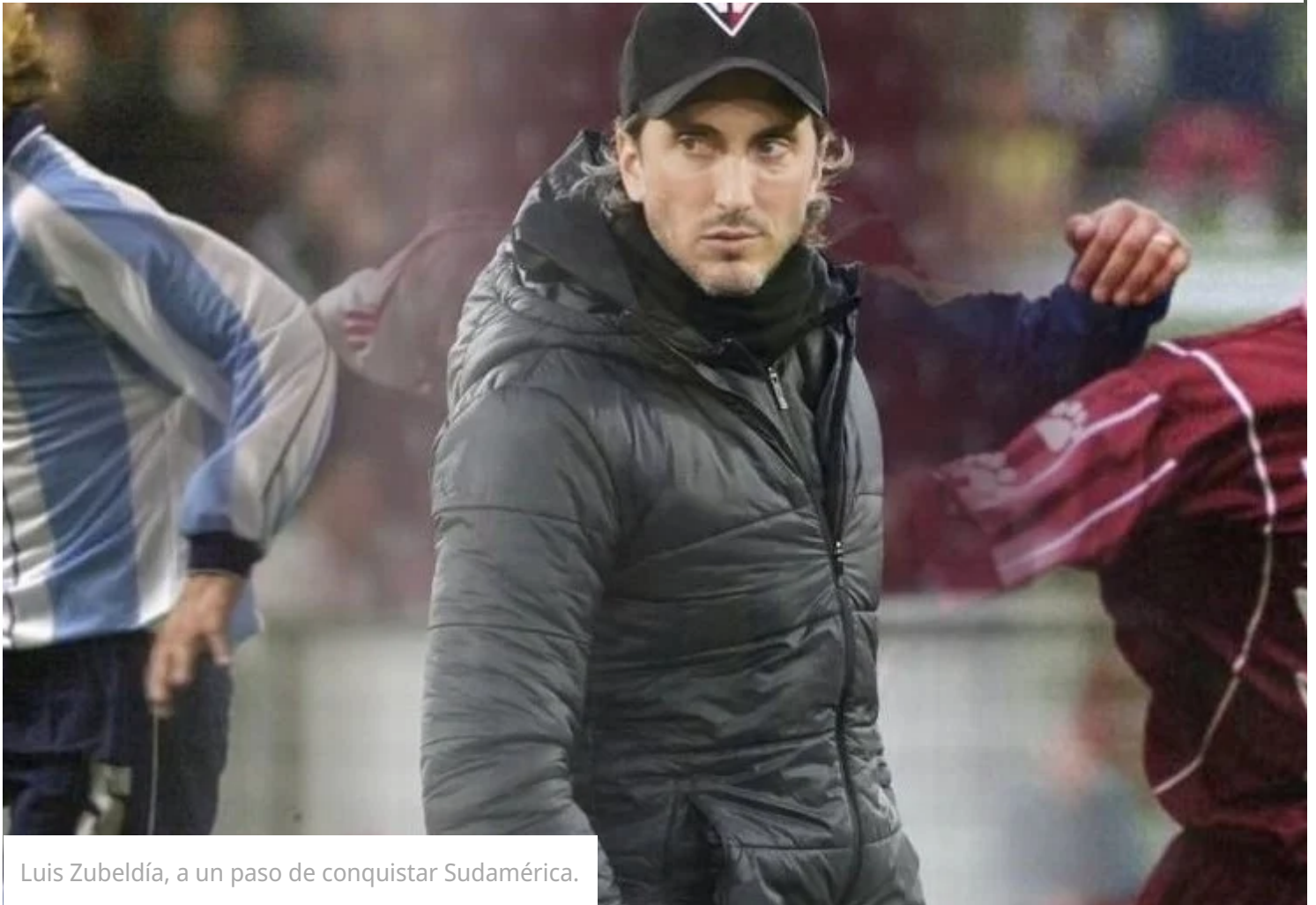
Luis Zubeldía, a un paso de conquistar Sudamérica.