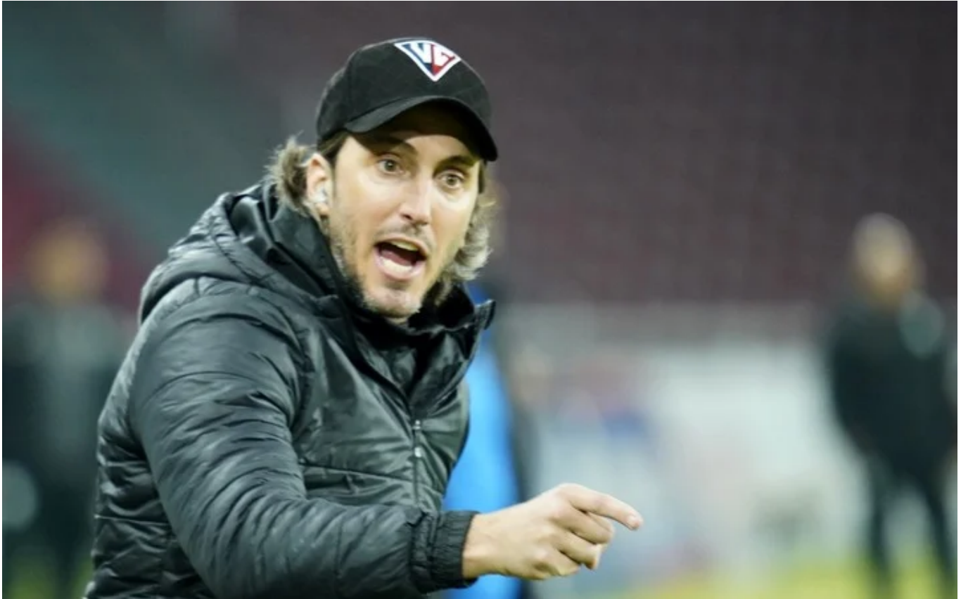
Luis Zubeldía, entrenador de Liga.

profesional puede terminar este sábado 28 de octubre en el Estadio Domingo Burgueño de Maldonado cuando enfrente a Fortaleza por la Sudamericana. La corona está ahí y el Príncipe quiere llegar a ser Rey de Copas.