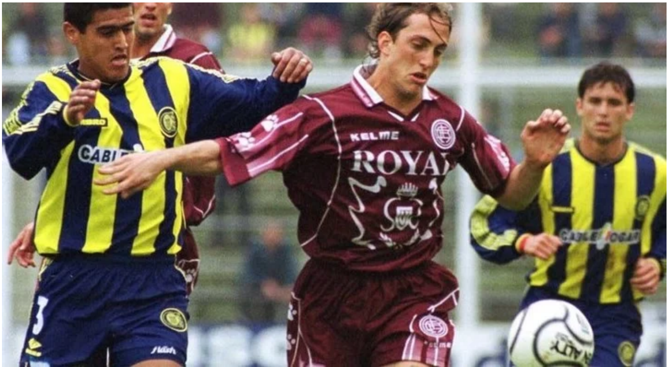
Luis Zubeldía, en su etapa como futbolista.

Pero nunca está muerto quien pelea y el pampeano jamás resignó su deseo de vivir del fútbol. Pese a su corta edad, se capacitó y poco después volcó su experiencia al estudiar periodismo deportivo y dirección técnica.