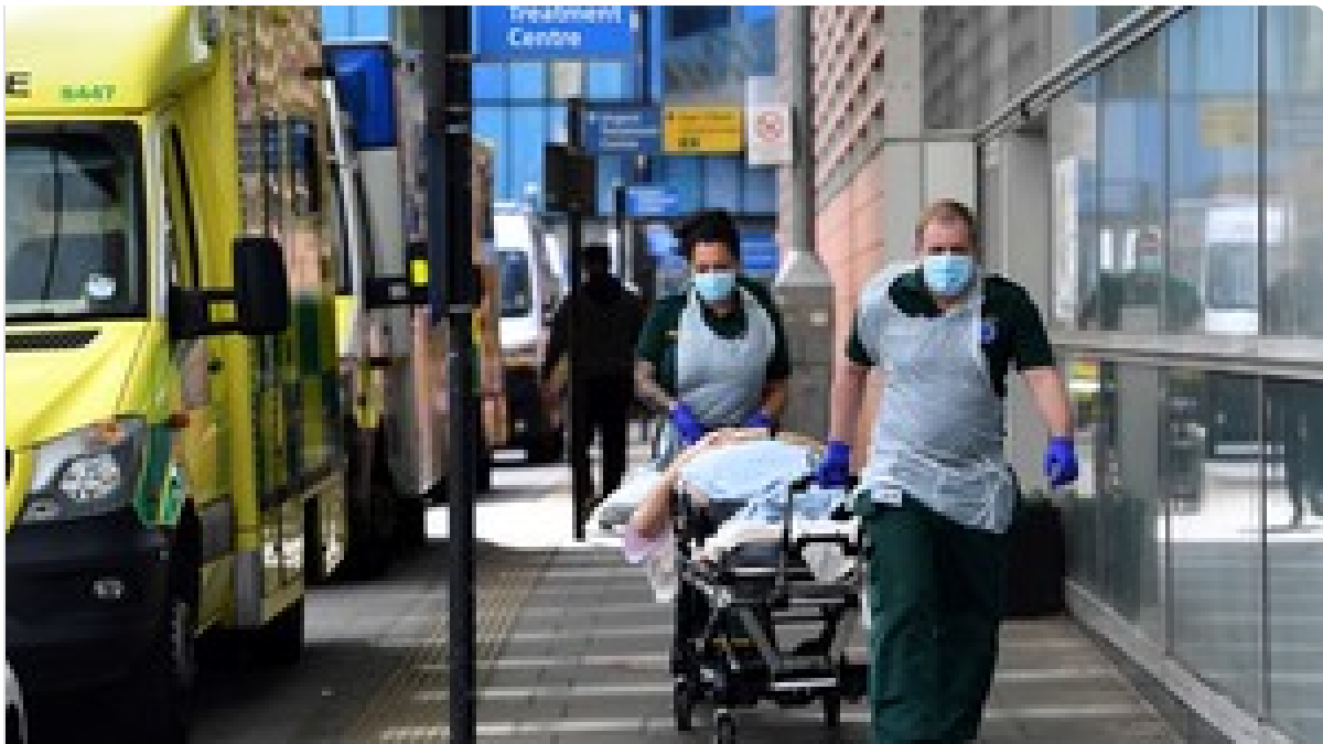
Horror en Gran Bretaña: afirman que los cadáveres de las víctimas del Covid fueron abusados sexualmente en la morgue