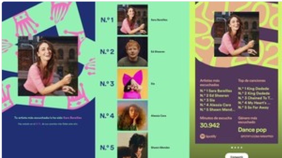
Spotify Wrapped 2023: qué es y cuándo sale el resumen de canciones del año