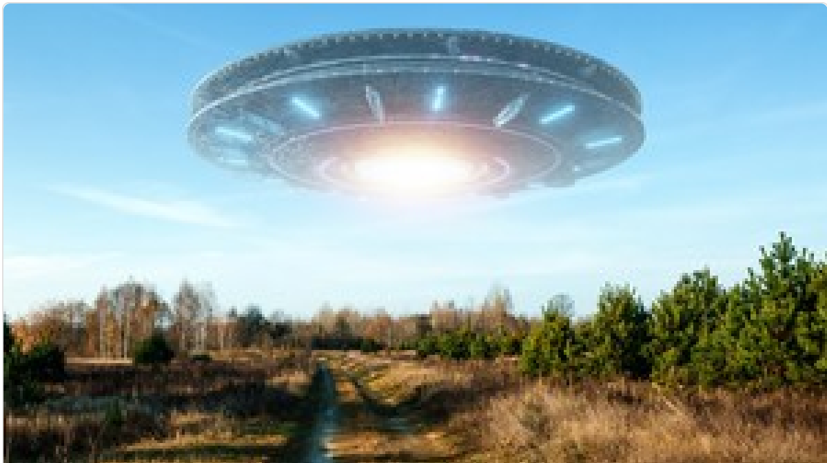
Impactante revelación OVNI: afirman que la CIA esconde "9 naves no humanas" halladas en la Tierra