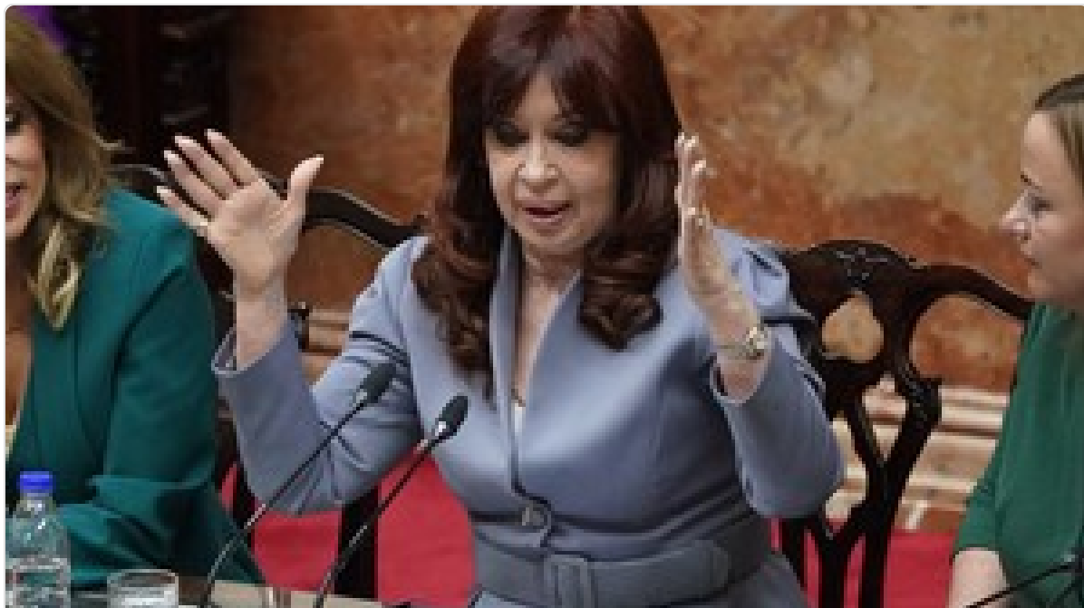
Cristina Kirchner dijo que fue Mauricio Macri el que revocó su sobreseimiento en la causa por la Ruta del Dinero K