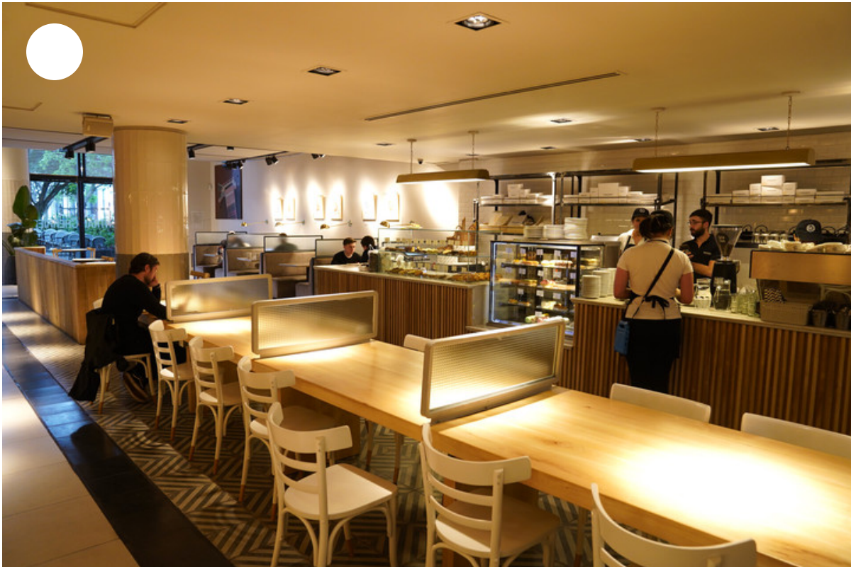
Recoleta, una de las sucursales que administra Civelli de Gotran Cherrier.

Tras levantarse el aislamiento, la preocupación de Renato, como también para gran parte del país, pasó a ser la situación económica: "La actualidad de Argentina es terrible.