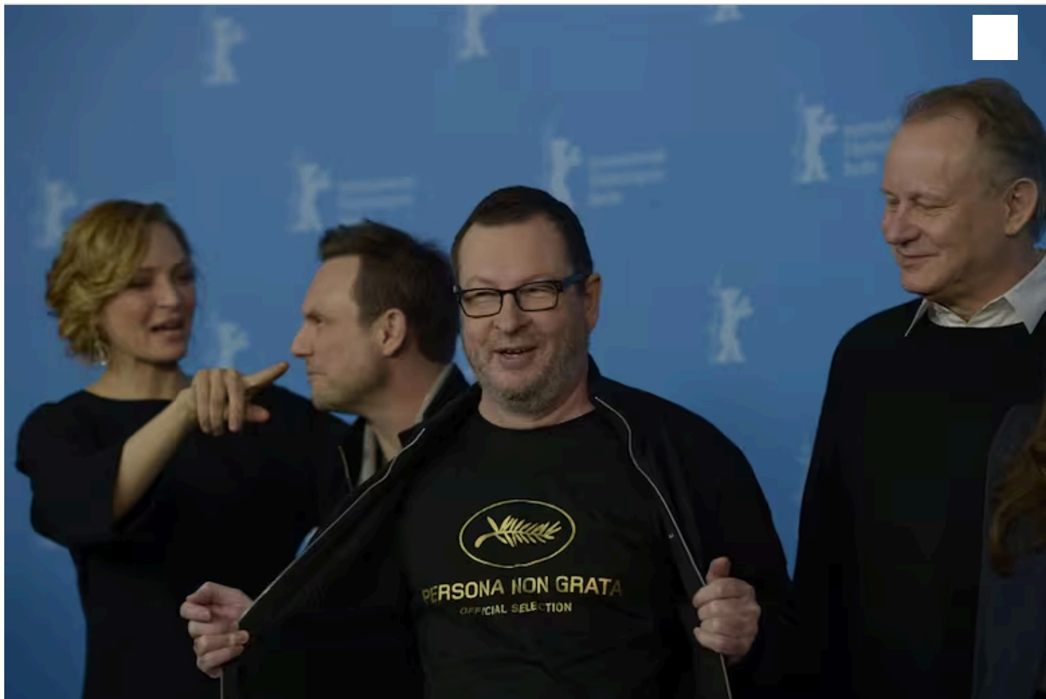
Lars von Trier, con su provocadora remera, junto a Uma Thurman y Christian Slater