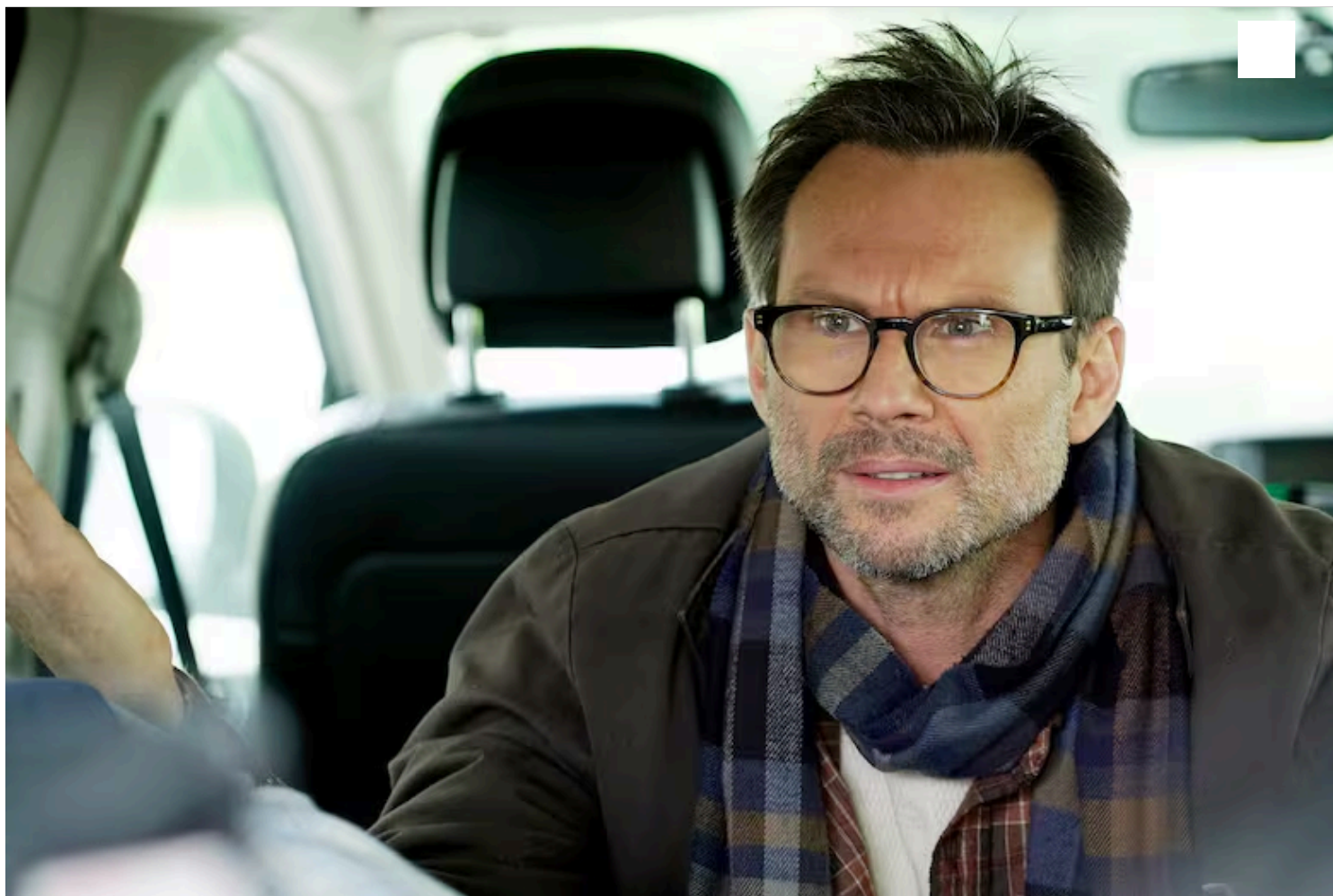
Christian Slater en Mr. Robot

Para quienes conocen a Slater mayormente por su trabajo en la notable serie Mr. Robot , conviene recordar que en sus primeros años como actor, un torbellino que empezó en Broadway, fue el protagonista de algunas de las películas más destacadas de la década del 80 y principios de los noventa . De padre actor y madre directora de casting, su carrera como intérprete comenzó casi como una extensión de la vida familiar. En 1980, a los diez años, fue seleccionado para trabajar en una nueva puesta de The Music Man , un exitoso musical que protagonizaba Dick Van Dyke. Un año después integró el elenco de Copperfield , otra exitosa puesta teatral. En 1982 tuvo un papel en Macbeth y luego protagonizó el musical Merlín . A los 15 años, Slater, ya un veterano de los escenarios con alguna experiencia en la TV, debutó en cine con la película La leyenda de Billie Jean , en la que interpretaba al hermano de la protagonista, una joven rebelde que huía de la ley a través del estado