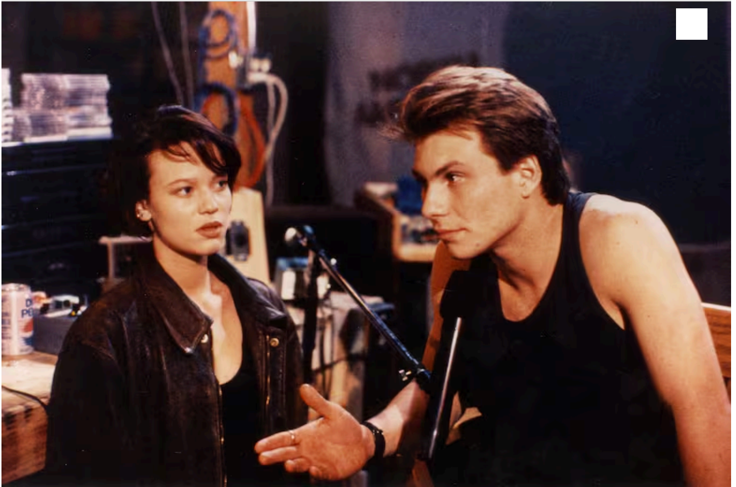
Suban el volumen, de 1990

con Johnny Depp y River Phoenix. Claro que su forma de actuar, su uso de la sonrisa sarcástica, sus expresivas cejas y esa mirada repleta de desafío y humor, parecían encajar a la perfección con los guiones que se producían en aquellos años que usaban el cinismo y la resistencia a las normas para decir algo sobre el estado del mundo en la era del capitalismo salvaje impulsado por el gobierno de Ronald Reagan.