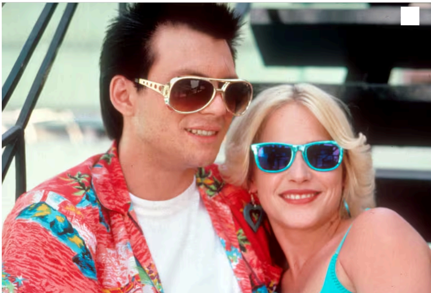
Slater junto a Patricia Arquette en Escape salvaje

realidad. Lo cierto es que el 90 por ciento del tiempo yo hacía todo lo posible para mantener esa percepción y ser ese tipo”, relataba hace unos años Slater al diario británico The Guardian.