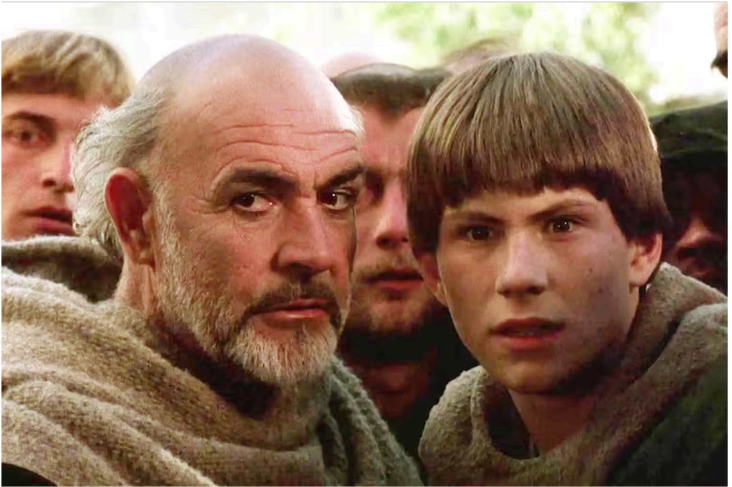
Sean Connery y Christian Slater en una escena de El nombre de la rosa

A esa primera incursión en la pantalla grande le siguió su primer gran éxito: El nombre de la rosa , el film adaptado de la novela de Umberto Eco que encabezó Sean Connery. A pesar del ridículo corte de pelo que lucía en la película dirigida por Jean-Jacques Annaud, con ese papel Slater probó que estaba listo para las grandes ligas. En poco tiempo fue el protagonista del thriller Twisted , participó en Tucker: el hombre y su sueño , de Francis Ford Coppola y consiguió el papel de J.D., el joven contracultural por antonomasia, en la película de culto Heathers o Escuela de jóvenes asesinos , el nada sutil título con el que fue estrenada en la Argentina.