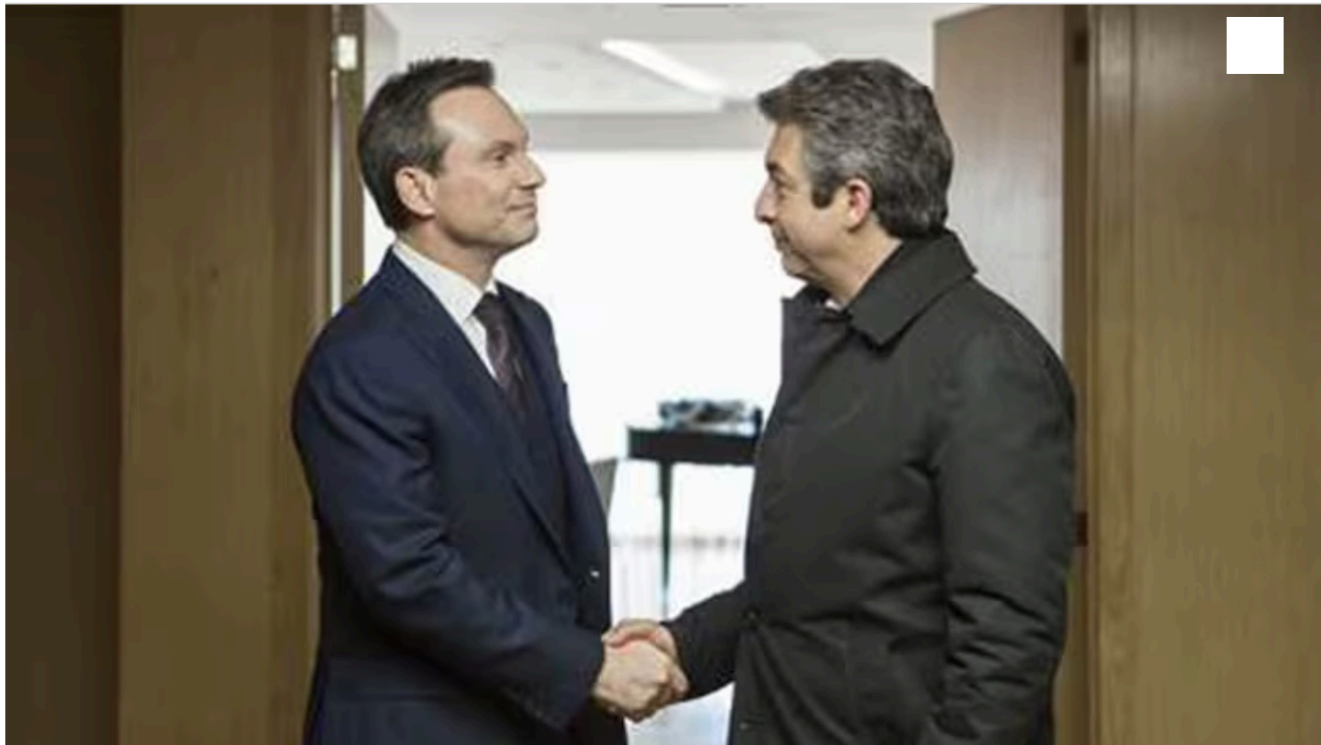
Ricardo Darín y Christian Slater en el rodaje de La Cordillera

hombre intentó detenerlo se desató una pelea que suscitó la intervención de la policía y a la que el actor también atacó a su llegada. En el juicio, Slater admitió que había estado bajo los efectos de la cocaína, la heroína y el alcohol y fue condenado a tres meses de prisión.